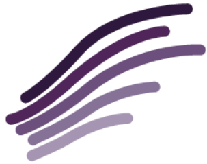
SPAZIO TOWER & SPAZIO